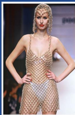
Paco Rabanne 1995