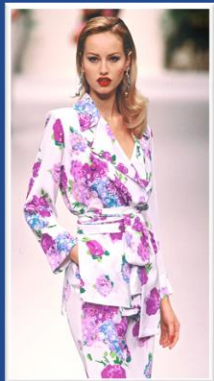
Yves Saint Laurent 1994