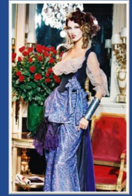
Vivienne Westwood 1998