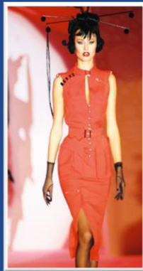
Thierry Mugler 1994